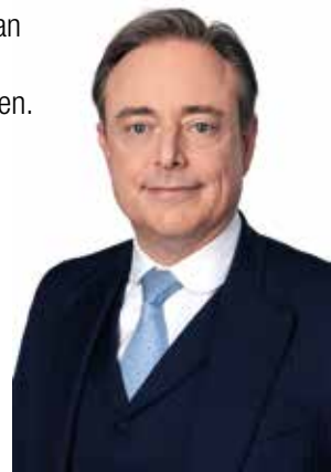
Bart De Wever Algemeen voorzitter