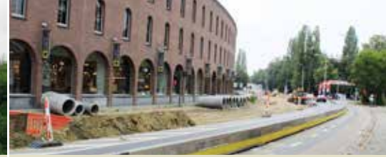
Werken Krijgsbaan: even op de tanden bijten (p. 3)