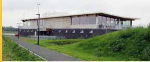
Sporten op hoger niveau in de Sporthaven (p. 2)