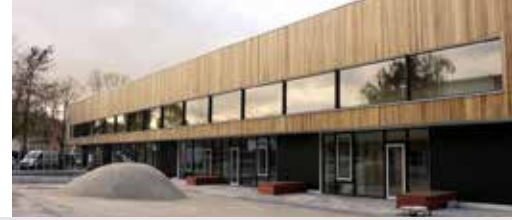
De Verandering werkt in Mortsels p. 2 en 3