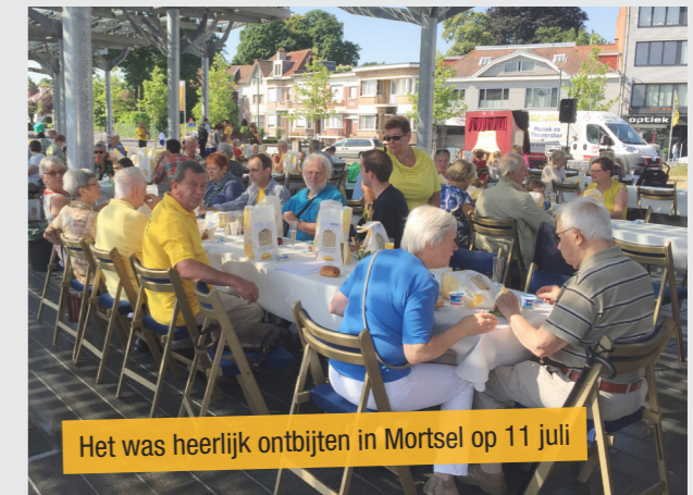
Het was heerlijk ontbijten in Mortsel op 11 juli