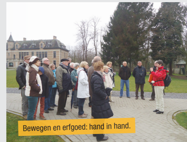
Bewegen en erfgoed: hand in hand.