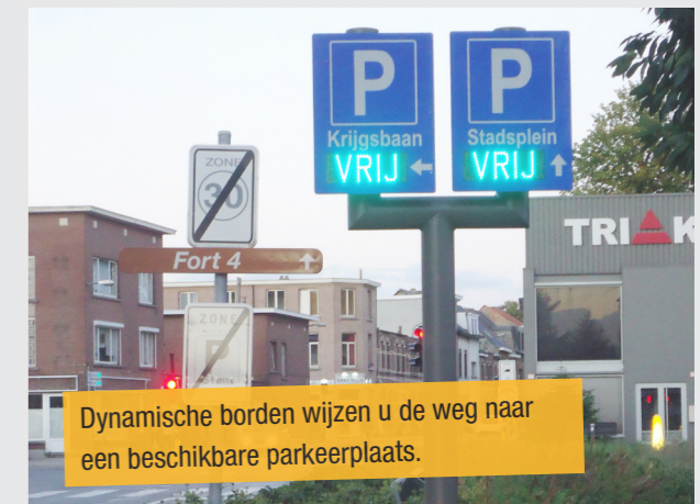
Dynamische borden wijzen u de weg naar een beschikbare parkeerplaats.