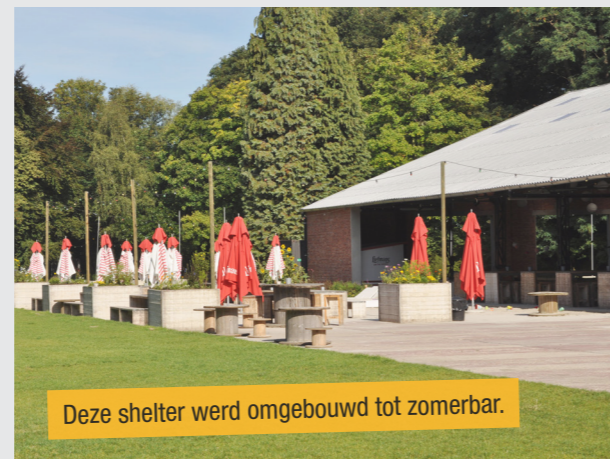
Deze shelter werd omgebouwd tot zomerbar.