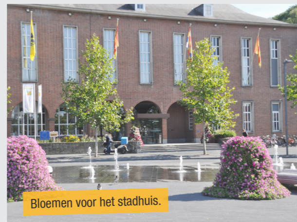
Bloemen voor het stadhuis.