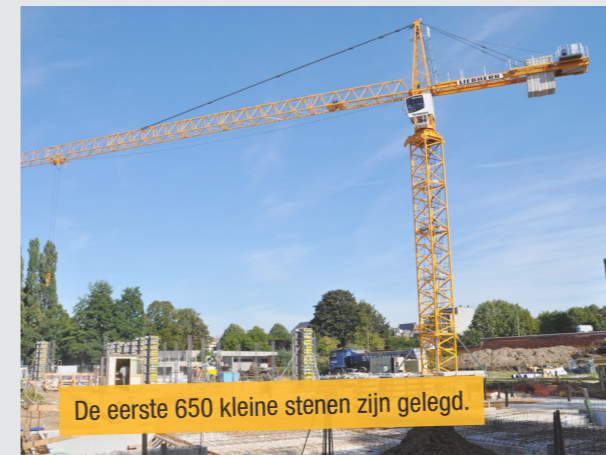
De eerste 650 kleine stenen zijn gelegd.